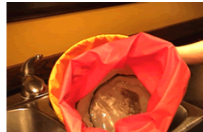
Après - After