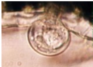
Capitata trichome (L. Basil)

Les trichomes (poils épidermiques) font partie des caractéristiques les plus saillantes à la surface d'une plante. L'apparence "velue" de plusieurs plantes communes est due à la présence de trichomes. Les trichomes glandulaires contiennent les huiles volatiles et autres sécrétions recouvrant la surface des feuilles et des pétales. Les plantes aromatiques (comme le Lavandin) et les herbes culinaires (telles la famille de la menthe, le thym, la sauge, etc.) contiennent toutes des huiles essentielles à l'intérieur des cellules formant le globe des trichomes glandulaires.