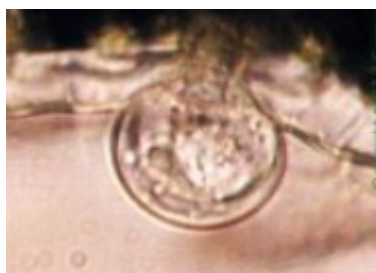
Capitate trichome (L. Basil)