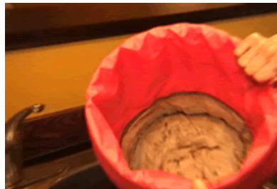
Avant – Before