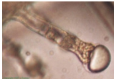
Peltate trichome from Ocimum ssp. (Basilic citronné)

Les diagrammes qui suivent démontrent deux catégories courantes de trichomes glandulaires chez l' Ocimum (Basilic citronné); classifiés peltate ou capitata selon leur morphologie: